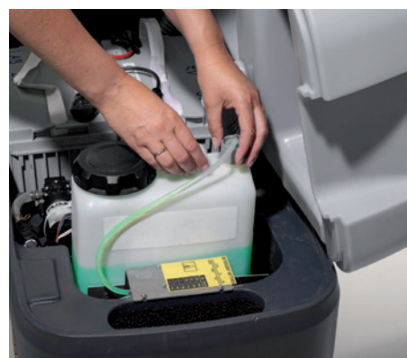
Дополнительный химический комплект Ecoflex аккуратно дозирует моющее средство и снижает затраты